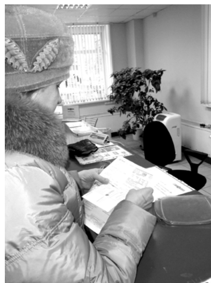
Повышение коммунальных платежей уменьшит и без того скудный бюджет пенсионеров и малообеспеченных семей.