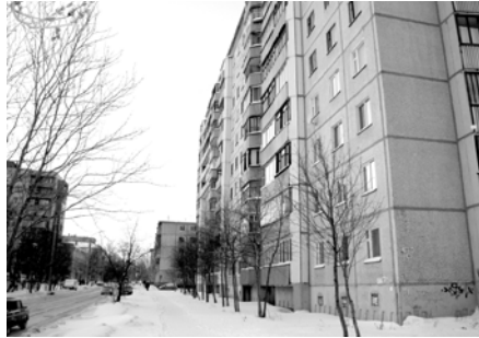
Жители дома ул. Гайдара, д. 27 рискуют остаться без значимых работ по содержанию дома.

Схожая ситуация с энергетиками, газовщиками и «Водоканалом». Един-