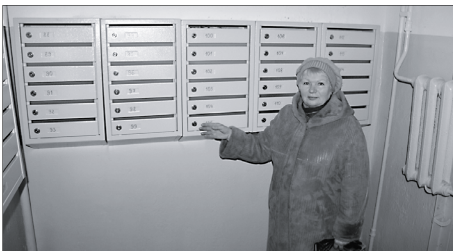
В первую очередь жители дома на Советских Космонавтов, 35 решили сделать косметический ремонт в подъездах.

Удачи, здоровья, счастья, новых побед на рабочем фронте!