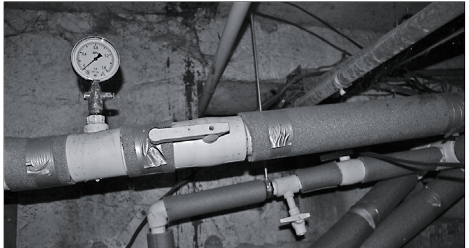
В доме заменили розливы холодного и горячего водоснабжения, установили скоростной водоподогреватель.