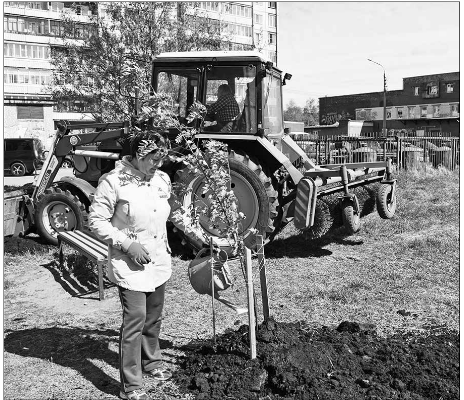
В «День соседей» на Маяковского, 27 вдоль тротуара высадили семь рябинок и разбили две клумбы с многолетними ирисами и васильками.

Сейчас вдоль тротуара высадили семь рябинок и разбили две клумбы с