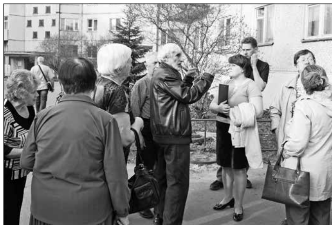
Собственникам квартир на Урицкого, 51 предлагают проголосовать за ремонт кровли и замену стояков холодного и горячего водоснабжения.

Кроме того, собственникам предлагается приступить к замене стояков холодного и горячего водоснабжения.