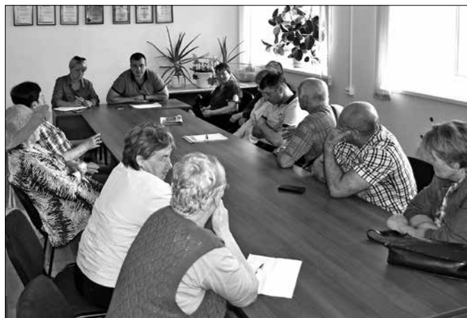
Жители дома на Ленинградском, 271, корп. 1 планируют направить средства капремонта на замену розливов холодного и горячего водоснабжения.

Второй важный вопрос касался повышения платы за содержание и текущий ремонт. Тариф в доме не меняли