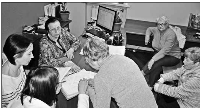
Собственники с Советской, 27 намерены этим летом менять розливы отопления.

много лет, поэтому он почти в два раза ниже, чем в соседних многоэтажках. При этом собственники недовольны качеством работы дворника и уборщицы, хотят установить светодиодные светильники и новые пластиковые окна в подъездах. Но откуда взять средства?