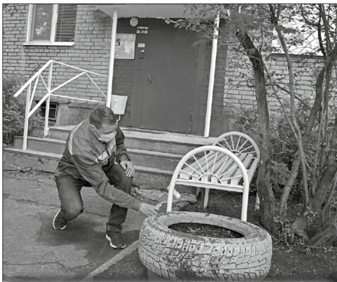
На Воскресенской, 105, корп. 1 произведена окраска входных групп и скамеек.

Весной произведена частичная замена внутридомовой системы электроснабжения на Никитова, 18 , смонтированы новые розливы горячего и холодного водоснабжения на Почтовом тракте, 26 . На Воронина, 31 провели косметический ремонт в 4-м подъезде. На Воронина, 39 ведутся работы по монтажу электрооборудования.