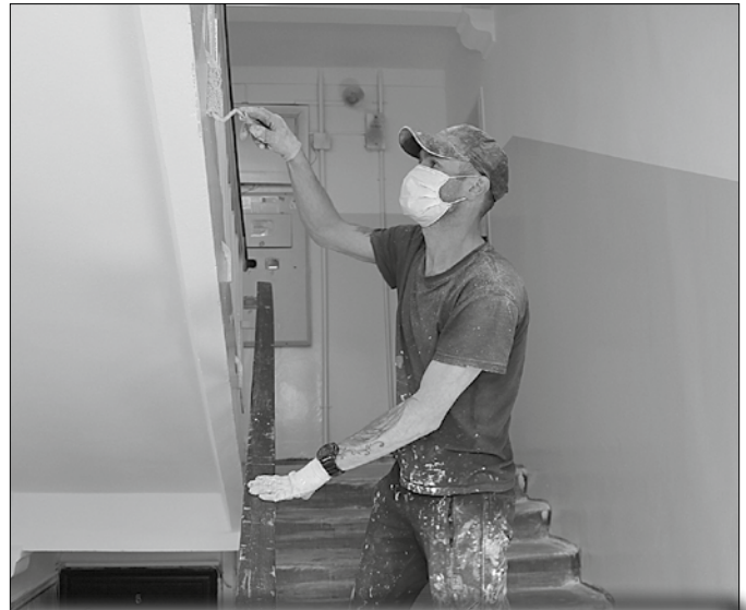
На Галушина, 9, корп. 1 проведён косметический ремонт: в апреле преобразился 3-й подъезд, недавно работы завершили в 1-м.

Кровлю обновили на Полярной, 8 и Кедрова, 15 . По последнему адресу также заменили стояки водоснабжения, канализации и циркуляции. На Советской, 32 на финиш-