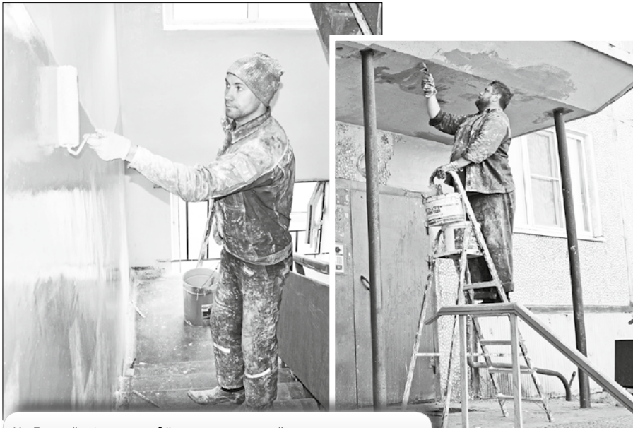
На Дачной, 49, корп. 4 идёт косметический ремонт в 1-м подъезде и окраска входных групп.