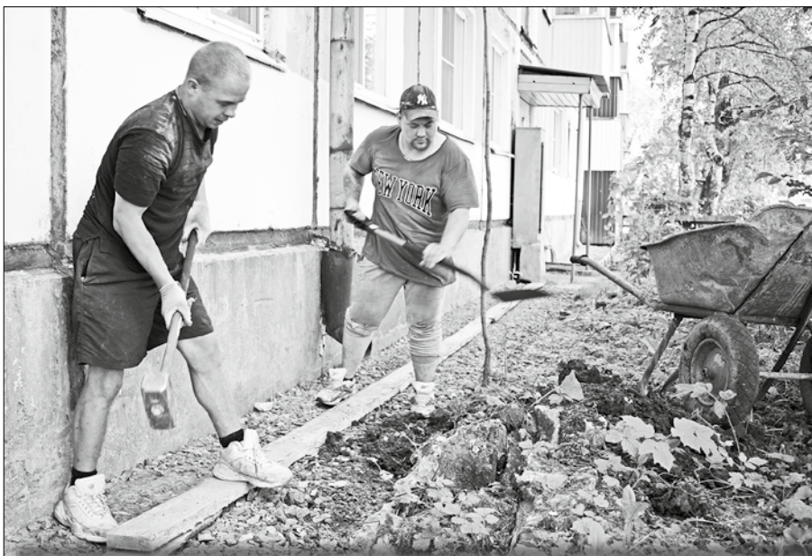
На Комсомольской, 43 ремонтируют отмостку по периметру дома.