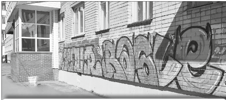
Так до окраски выглядел фасад жилого дома на Никольском, 92.

Испорченные руками вандалов фасады жилых зданий – проблема большинства городов России. Архангельск, к сожалению, не исключение. И речь не о красивых, несущих смысл граффити, выполненных руками художников, а о неказистых, уродующих дома рисунках и надписях. Они видны издали, и такое «творчество» явно не украшает городские строения.