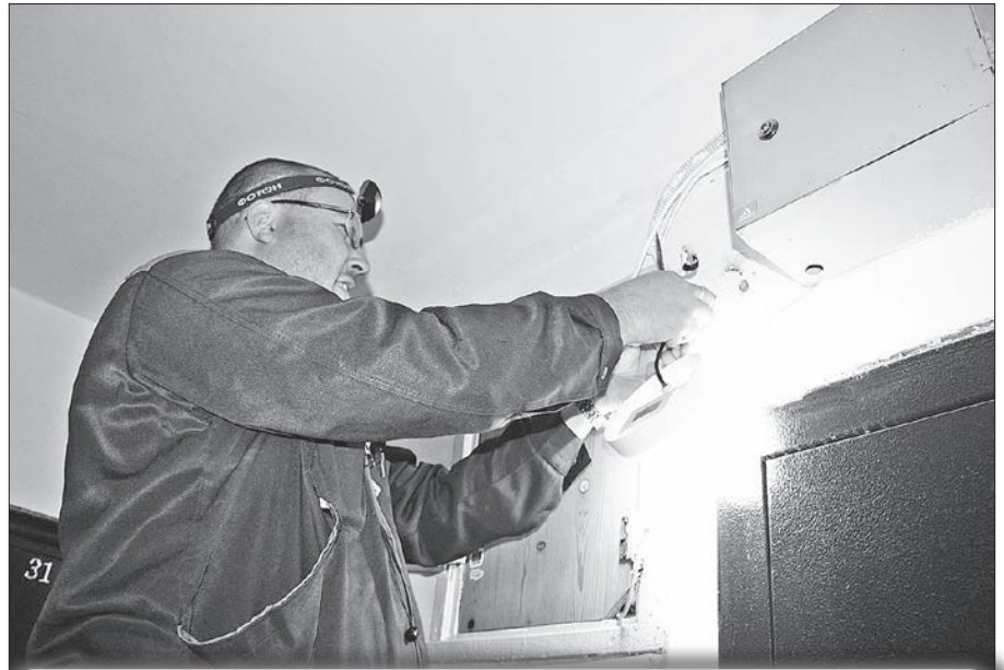
Подъезды Никольского, 88 оборудовали светодиодными светильниками с датчиками движения и звука.

В группе компаний «Соломбала» в августе на Красных Партизан, 14, корп. 1 частично заменён розлив ка-