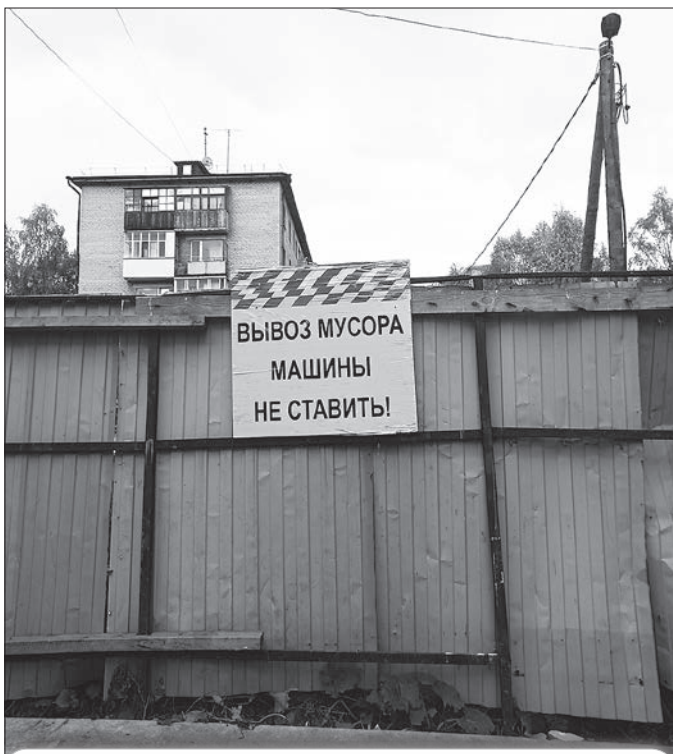
Ленинградский, 341, корп. 1

Стоит отметить, что ремонт дворов в рамках программы благоустройства почти всегда включает в себя обустройство автомобильных парковок. В группе управляющих компаний СРО «Гарант» стоянки для транспорта с 2017 года были оборудованы на Р. Люксембург, 23; Красных Партизан, 16; Дзержинского, 3, корп. 1 и корп. 3; Полярной, 17; Воронина, 31, корп. 3; Воронина, 43, корп. 1; Ленинградском, 273, корп. 1 и Ленинградском, 277, корп. 1. Жители довольны результатом проведённой работы.