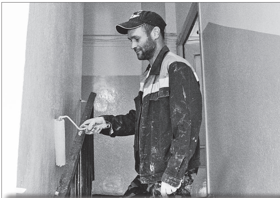
На Воскресенской, 105 проведён косметический ремонт во 2-м подъезде.

Ремонт отмостки вскоре начнется на Обводном канале, 44 , а на Ломоносова, 285, корп. 1 он уже идёт полным ходом. Здесь также приводят в порядок цоколь здания и делают продухи, чтобы подвал вентилировался. В августе в рамках текущего ремонта в доме утеплили межпанельные швы в трёх подъездах, сейчас в 3-м подъезде делают косметический ремонт. Свежая «косметика» вскоре порадует и жителей 2-го подъезда на Гайдара, 27 , там уже начались работы.