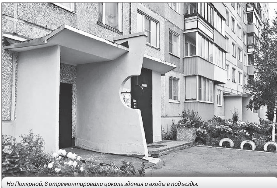
На Полярной, 8 отремонтировали цоколь здания и входы в подъезды.

Между тем инициативные жители многоквартирных домов уже начали планировать работы на следующий ремонтный сезон. Если в вашем доме проходит голосование собственников, не игнорируйте бюллетени, внимательно ознакомьтесь с предложениями и сделайте свой выбор.