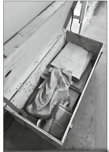
На Розы Люксембург, 23 стоял огромный ящик со строительным мусором, мешками и прочей ветошью.