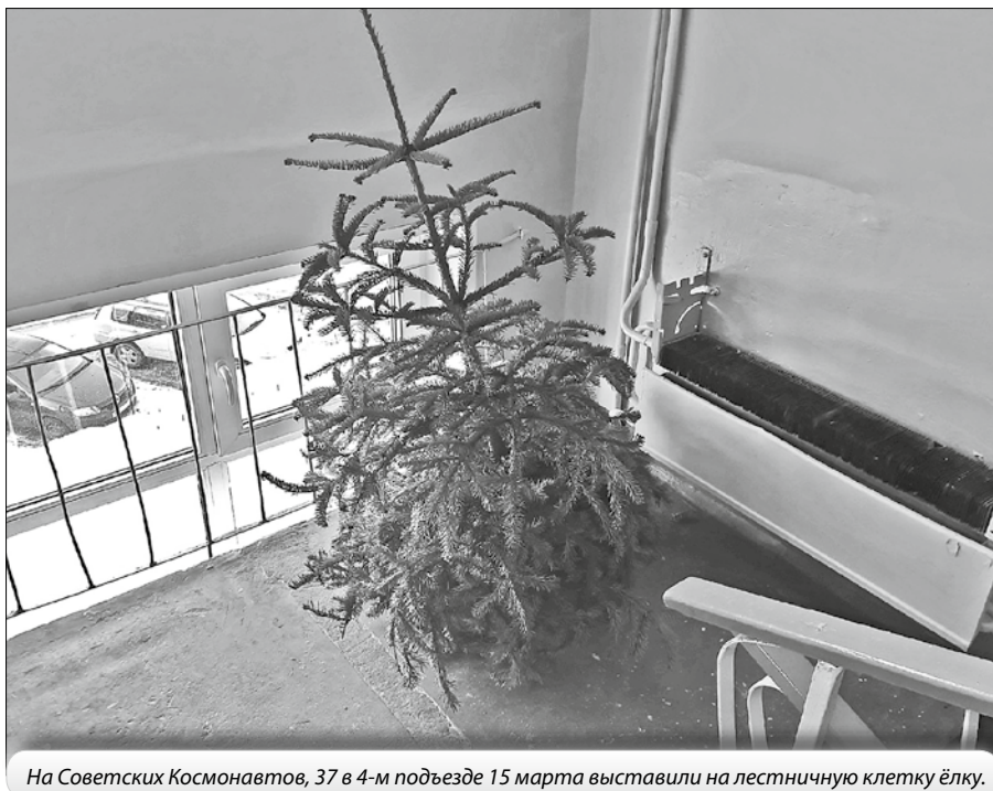
На Советских Космонавтов, 37 в 4-м подъезде 15 марта выставили на лестничную клетку ёлку.

Отдельное «нельзя» для собственников и жителей – на обустройство кладовых на лестничных площадках и в подлестничном пространстве. Они под запретом, потому что в контексте противопожарного режима также представляют собой вещи и мусор, которые хорошо горят и дымят, а значит, очень опасны.